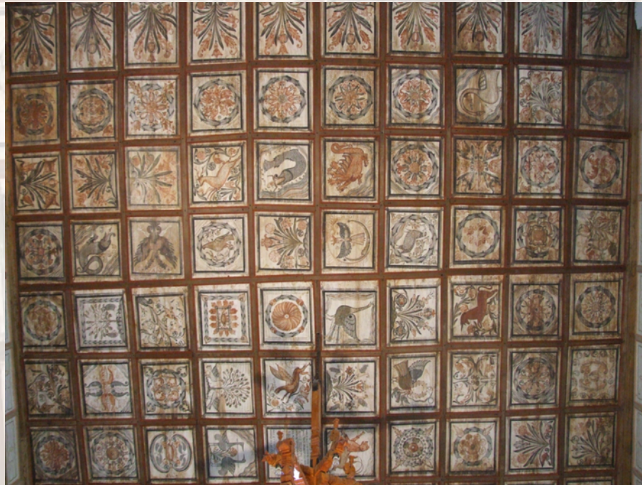
Illusztráció: Kraszna, református templom. Festett famennyezet 1736-ból, PATAKI ASZTALOS János munkája. Restaurálás utáni állapot Illustration: Crasna, Calvinist church. Painted wooden ceiling from 1736, János PATAKI ASZTALOS's work. After conservation

Keywords: ceilings, painted ceilings, coffered ceilings, painted coffered ceilings, painted wooden panels, deterioration, assessment of damage, conservation; maintenance.