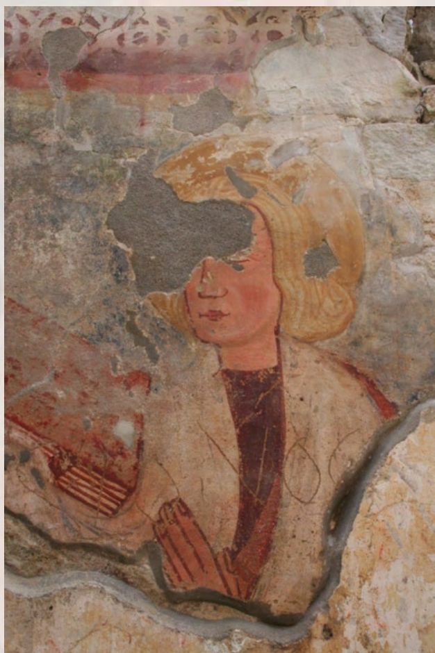
Illustration: Nima, the figure of an Apostle on the chancel's southern wall Illusztráció: Néma, Apostolfigura a szentély déli oldalán

Kulcsszavak: egyházi építészet, templomok, veszélyeztetett kulturális örökség, megelőző konzerválás, falfestmények, tisztítás, Erdély, Románia.