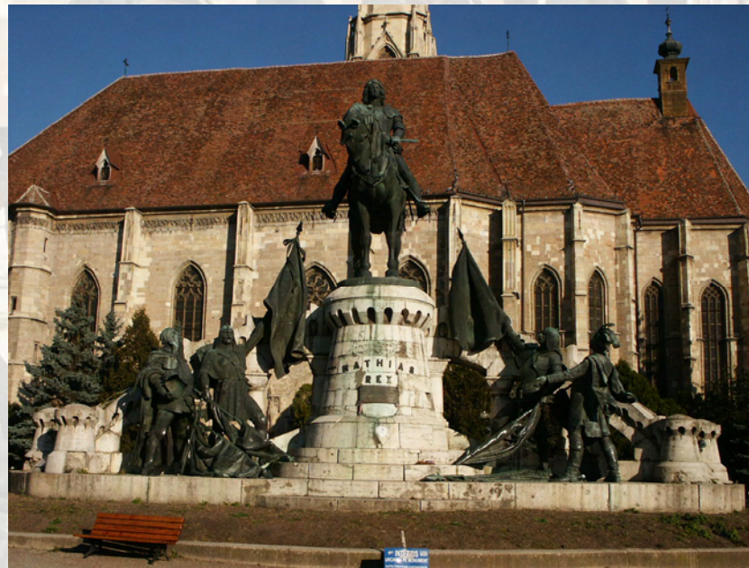
Ilustrație: Grupul statuar Matia Corvinul Illustration: Matthias I sculptural group

Keywords: sculpture, monumental sculpture, statues, conservation, reinforcement, analysis of materials, stone, bronze, Cluj-Napoca.