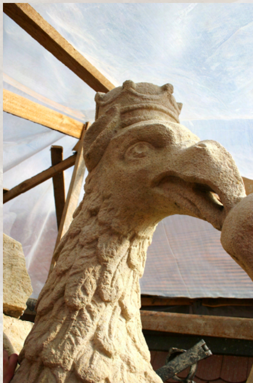
Illusztráció: A címert tartó griffmadár feje restaurálás után Illustration: The head of the supporter griffin after conservation

Keywords: historic building, palaces, conservation, sculptures, stone, balconies, restoration, Cluj-Napoca, Bánffy family.